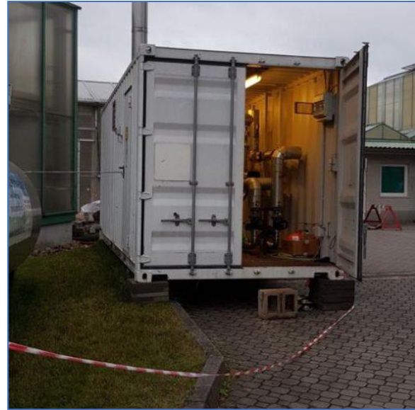
Obr. Mobilní kotelna

Emitent plánuje své produkty nabízet subjektům jako jsou domovy důchodců, pečovatelské domy, léčebny dlouhodobě nemocných nebo nemocnice, které většinou mají záložní zdroj elektrické energie, ale již nemají záložní zdroj tepla, přičemž všechna tato zařízení jsou závislá na teplé vodě a topení. Emitent je schopen při výpadku tepla spustit náhradní zdroj do jedné hodiny. Narozdíl od záložních zdrojů na výrobu elektrické energie nejsou v Česku záložní kotelny pro nemocnice či sociální zařízení standardem (jako například v Německu), a je zde tak dle názoru Emitenta velký prostor pro růst.