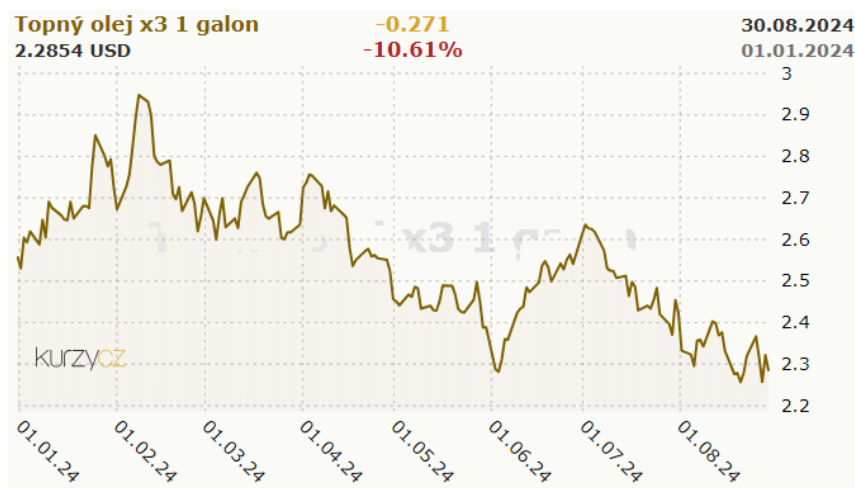
Graf: Vývoj ceny topného oleje (zdroj: www.kurzy.cz )

Vzhledem k tomu, že se topný olej vyrábí z ropy, je i jeho cena odvozena od tržní ceny ropy. Ta je závislá nejen na nabídce a poptávce na trhu, ale i na nestabilní politické situaci v zemích, které dominují těžbě této suroviny. Mezi ně patří především země Středního východu. V tabulkách a grafech prodeje topného oleje se obvykle operuje s jednotkou jeden galon (= 3,79 litru oleje). V polovině února 2022 stál 1 galon topného oleje 2,93 USD (69,64 CZK), v březnu 2022 pak cena vyšplhala až na 4,5 USD (106,97 CZK) vzhledem k situaci na Ukrajině, která byla napadena Ruskem. Ke dni vyhotovení Základního prospektu se cena topného oleje pohybuje kolem 2,3 USD / 1 galon, což odpovídá hodnotě cca 52,09 CZK / 1 galon. 2